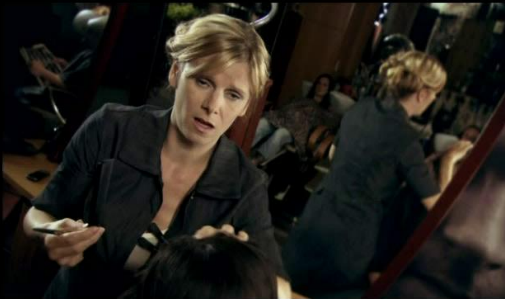
TV spot Frizerka MojD – dodatna obrazložitev paketa