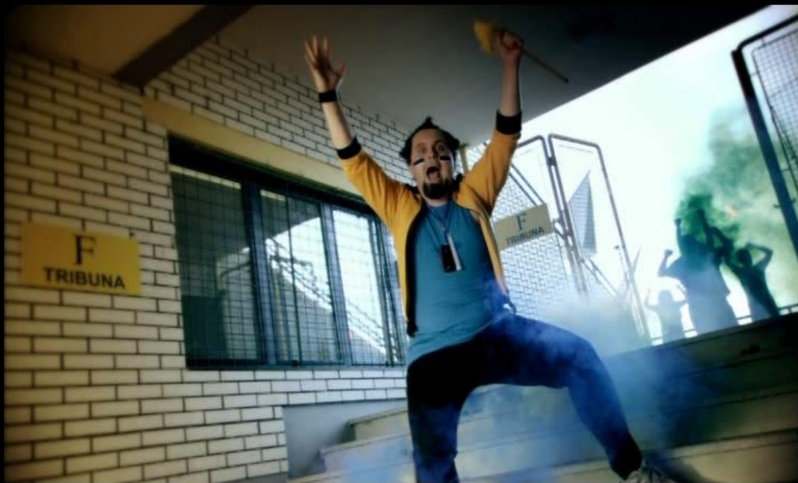
TV spot Navijač MojD - launch