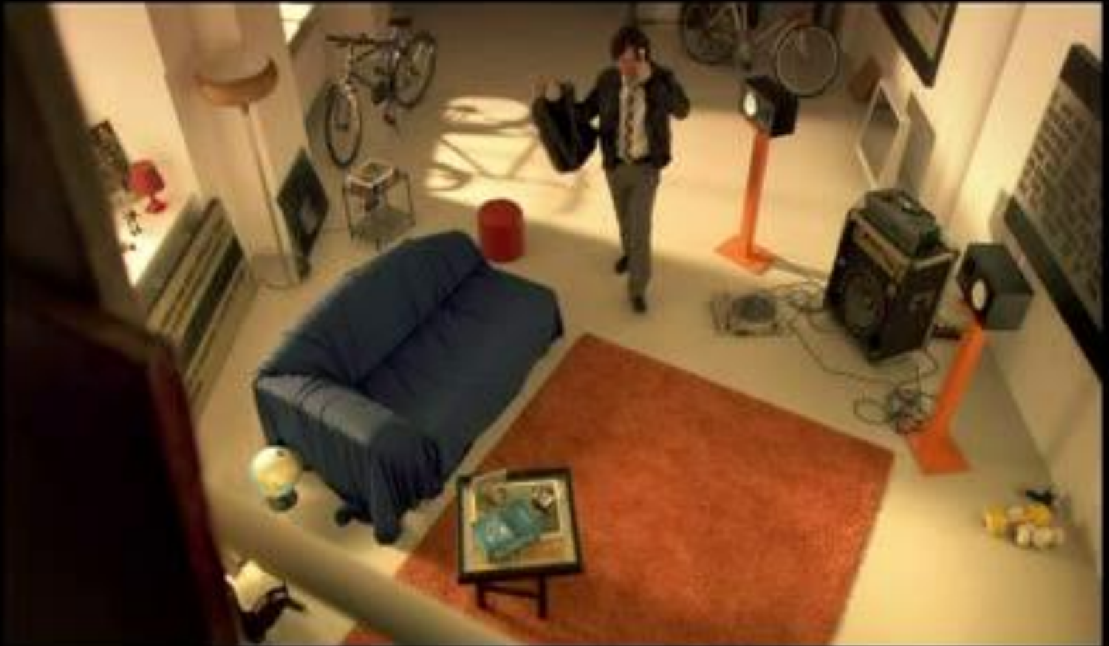
TV spot NajinD - launch