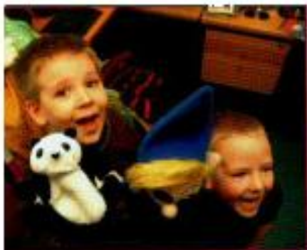
Iz obiska na Kliničnem centru

Prejšnji teden je bilo v Kliničnem centru na oddelku za otroško kirurgijo in intenzivno nego spet veselo. Lutkovna predstava »Lutkovni variete«, ki sta jo obolelim otrokom podarila Slovenica Življenje in Lutkovno gledališče Ljubljana, je nasmeje na obraz narisala 26 otrokom, ki dan za dnem že leta prebivajo za štirimi stenami največje slovenske bolnišnice.