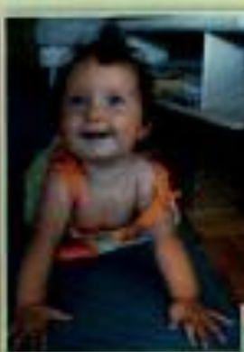
Autor slike: Mojca Nemec, Marjeta Soban, Alisa Muri

Zmagovalca finalnega izbora akcije Smisel življenja so otroški nasmehi! bomo razglasiti 24. januarja 2006 na slovesni prireditvi življenjske zavarovalnice SLOVENICE ŽIVLJENJE d.d. v Lutkovnem gledališču v Ljubljani, na katero bodo povabljeni tudi vsi avtorji fotografij in vsi otroci, ki so se uvrstili v ožji izbor za najlepši otroški nasmeh.