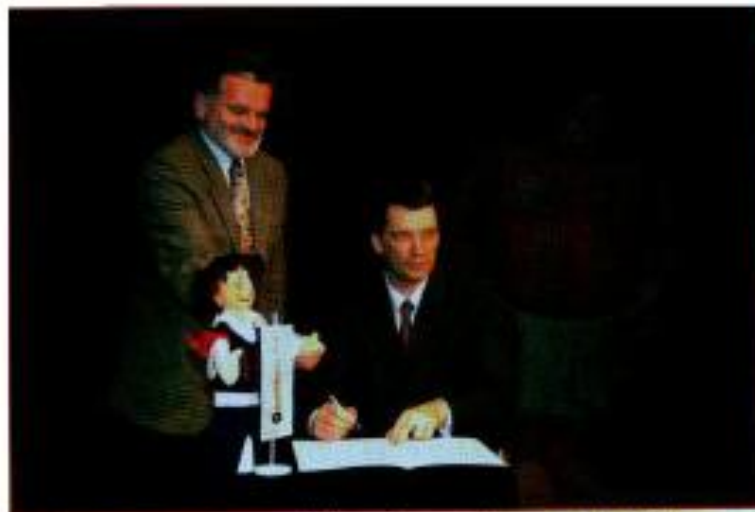
Podpis dogovora o dolgoročnem poslovnem partnerstvu