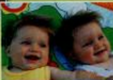
Autorije slike: Maja Klitar, Tereza, Taja in Polena, Daria Jurec