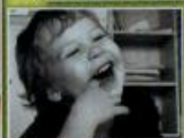
Autor slike: Jaka Štečaj, Ljubljana, Jaka