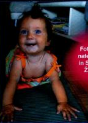
Fotografski natečaj Jane in Slovenice Življenje

Priznamo, nimamo se mogli upirati: prisrčnim fotografijam in pa molči, da bi čakali še vse do konca junija, da bi se zmagovalci lepe pokrili z meseci. Tako pač kar začenjamo s prvimi potnimi zmagovalnimi nasmehi, sliodenimi za vedno na fotografijah, katerih avtorji bodo prejeli po dve vstopnici za ogled predstave v Lutkovnem gledališču Ljubljana in bodo uvrščeni s finalno izbiro za velike nagrade konec leta. Pred vami so: