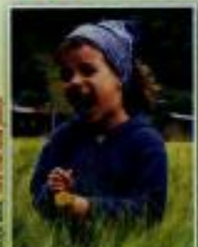
Autor slike: Milica Begonja, Škofja Loka, Sara in Anja Jakič